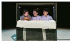
Un tros de pa Cia. Les Pinyes