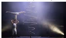
Spiratis Cia. Bool