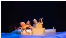
Les sirenes són calbes Cia. Deliri