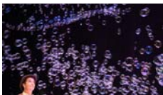
Vegin i Passin Cia Enlaire