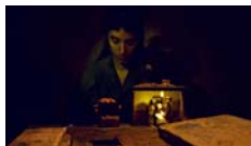
An-ki Cia. Ortiga