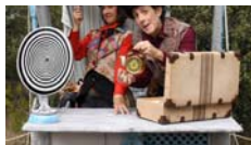
De Faula La Guilla Teatre