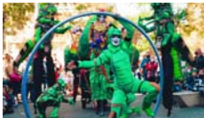
Metamorphosi Cia. Companyia Todozancos