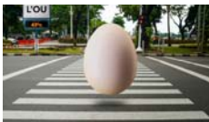
Ou PocaCosa Teatre