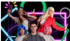
Feedback, el musical La Carpa Produccions