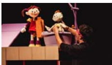
Es ven germà petit Centre de Titelles de Lleida