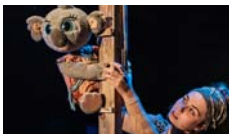
Bunji, la petita coala Festuc Teatre