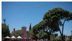
Vermut PRO Presentació projecte Originària