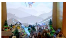
Mapping de butxaca Dandream films