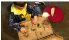
Projecte comunitari Originària Cia. Ortiga

festival infantil i juvenil d'arts escèniques de Montmeló