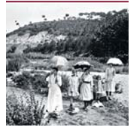
Dissabte 23 | 10 | 2022 11.00 h | Museu Municipal de Montmeló L'estiueig de Carmanyola

La actividad, que fue postpuesta debido al riesgo de lluvia, ya tiene una nueva fecha: el domingo 23 de octubre a las 11 horas y tendrá el punto de partida en la plaza Joan Miró, justo enfrente del Museo Municipal de Montmeló y finalizará en la Torreta, con un aperitivo, juegos infantiles y deportivos que practicaban