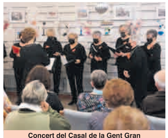
Concert del Casal de la Gent Gran