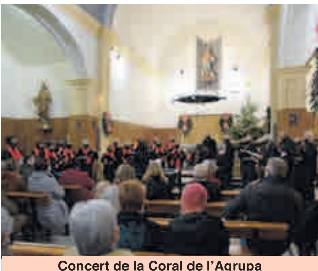
Concert de la Coral de l'Agrupada