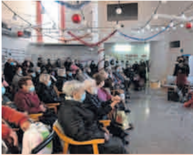
Concert de l'INS al Casal de la Gent Gran