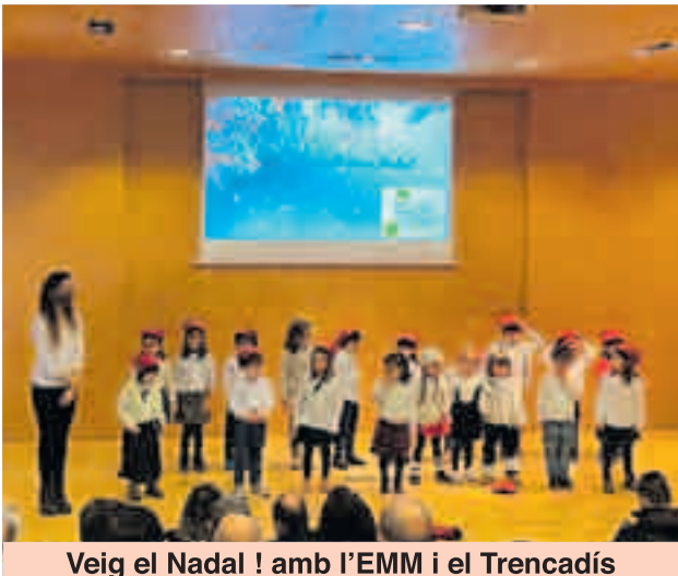
Veig el Nadal ! amb l'EMM i el Trencadís