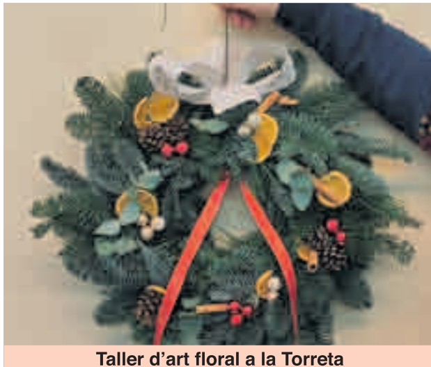
Taller d'art floral a la Torreta