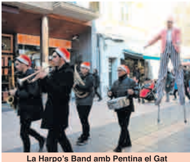
La Harpo's Band amb Pentina el Gat