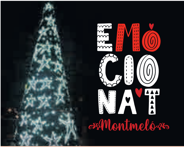
Encesa de l'arbre de Nadal