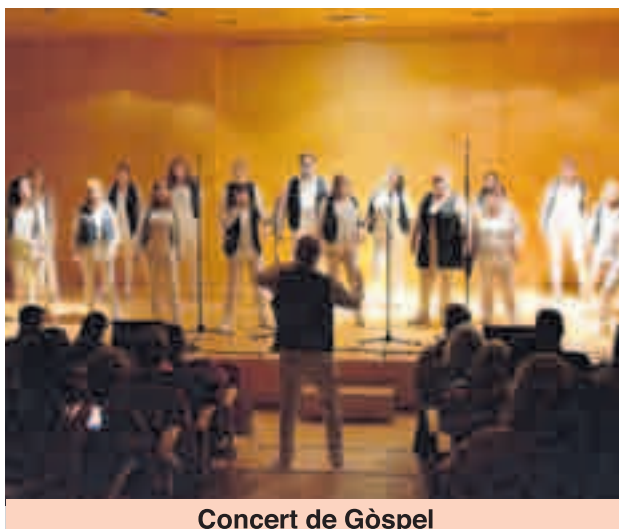
Concert de Gòspel