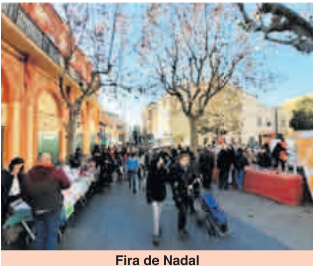
Fira de Nadal