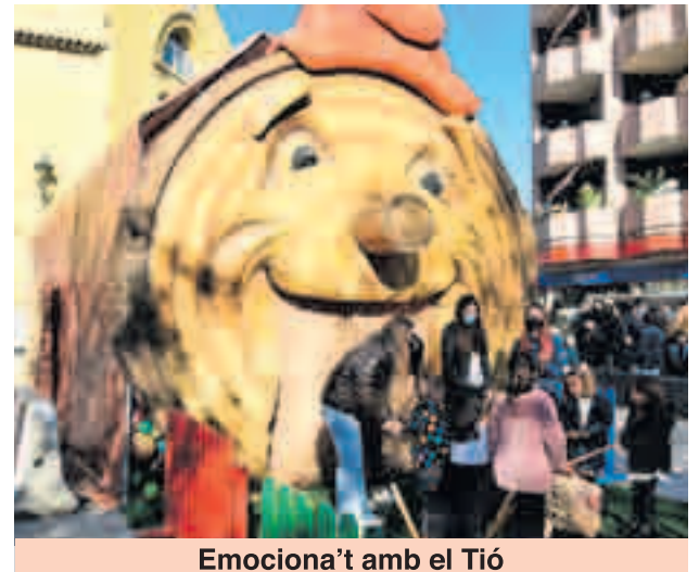
Emociona't amb el Tió