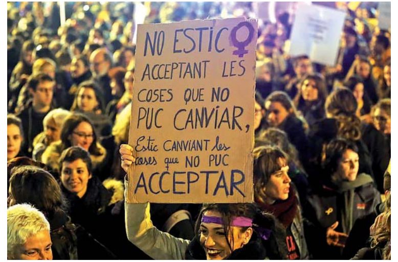
Manifestació del 8M de 2018 a Barcelona.

La desigualtat de gènere no només suposa un problema moral i social urgent sinó també un desafiament econòmic. Encara persisteixen grans bretxes de gènere a tot el món i la pandèmia de la Covid-19 ha tingut un impacte regressiu sobre les dones. Algunes causes estan associades a les discriminacions i desigualtats que pateixen les dones, en l'àmbit familiar, laboral, retributiu, etc.