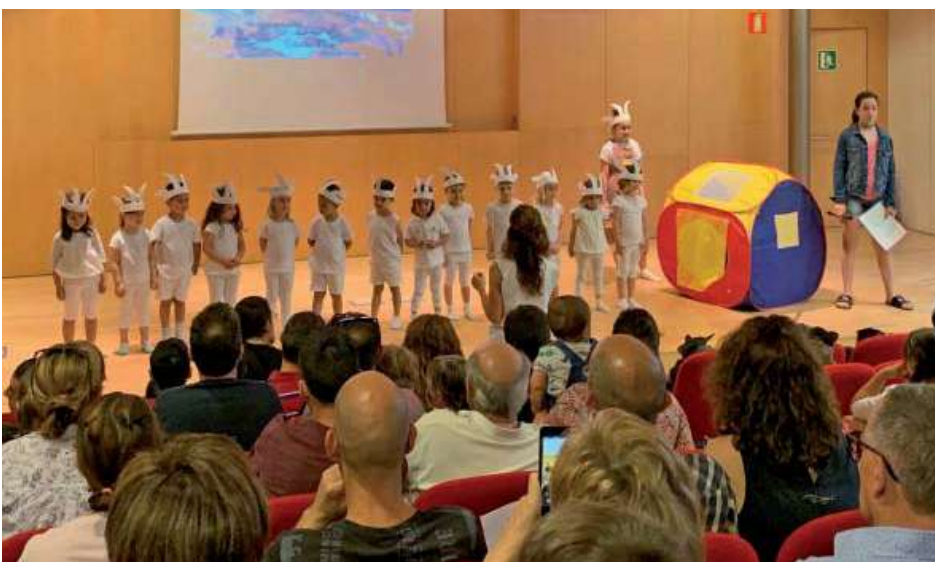
Cantata infantil de l'Escola Municipal de Música