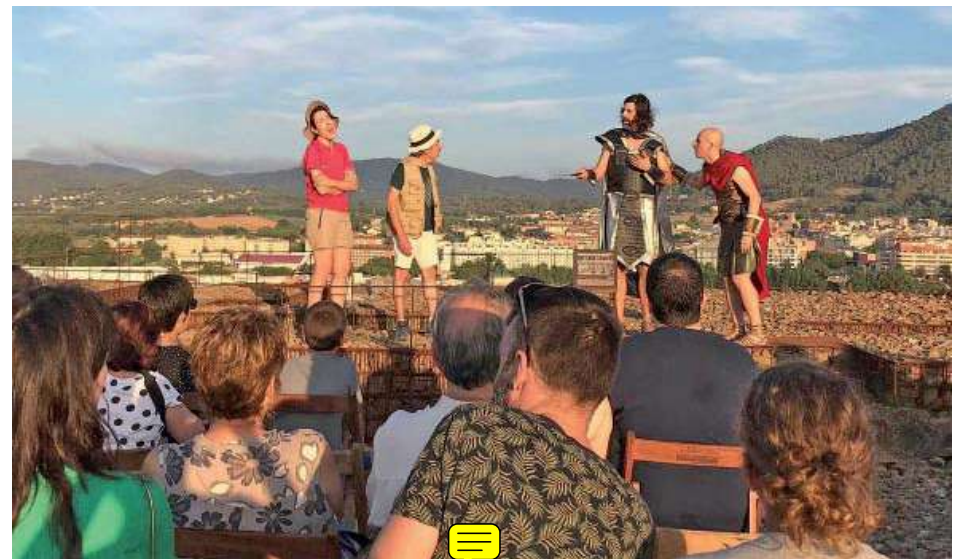
Nits d'Estiu a la Romana: Comèdia Tempus FUGit