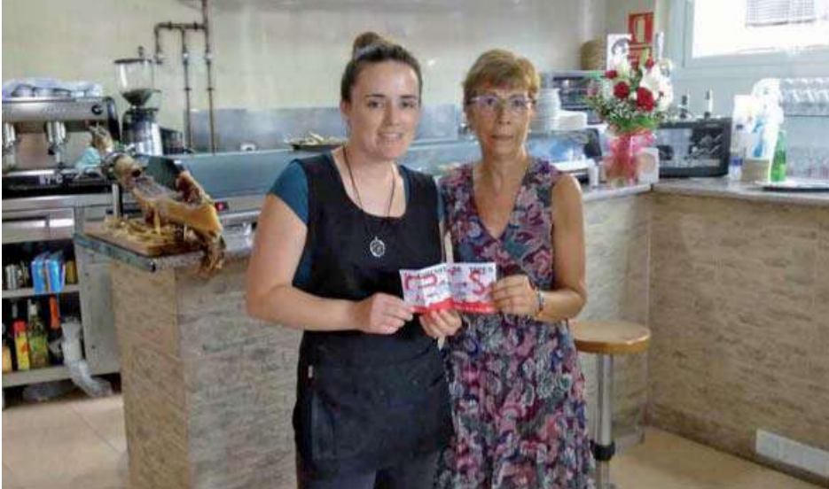
Circuit de Tapes. Bar El Momento, guanyadora de la millor tapa 2019