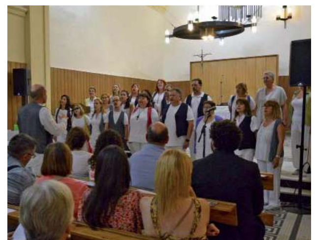
Concert de Gòspel