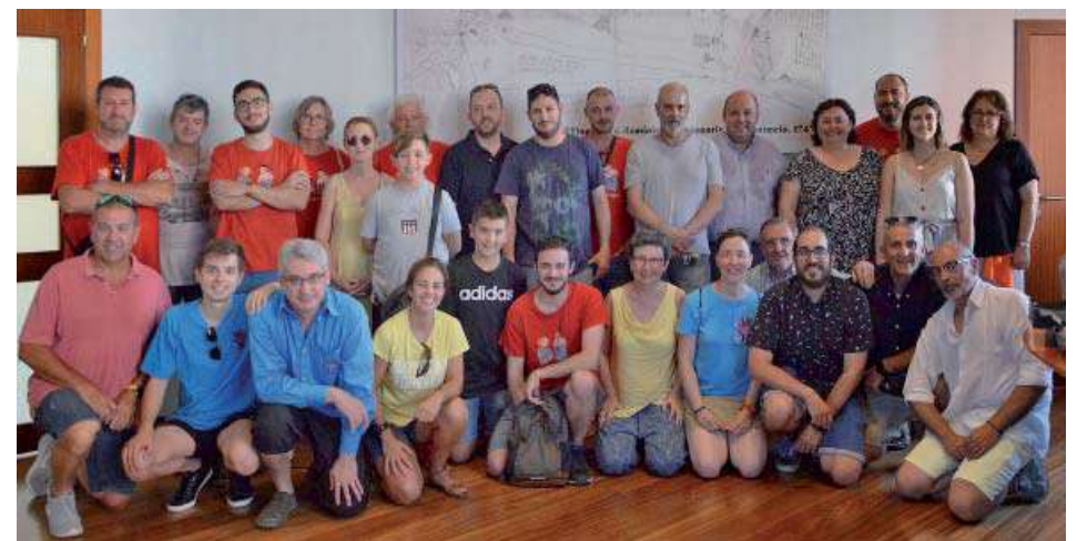
Visita del Geganters de Campos (Mallorca)