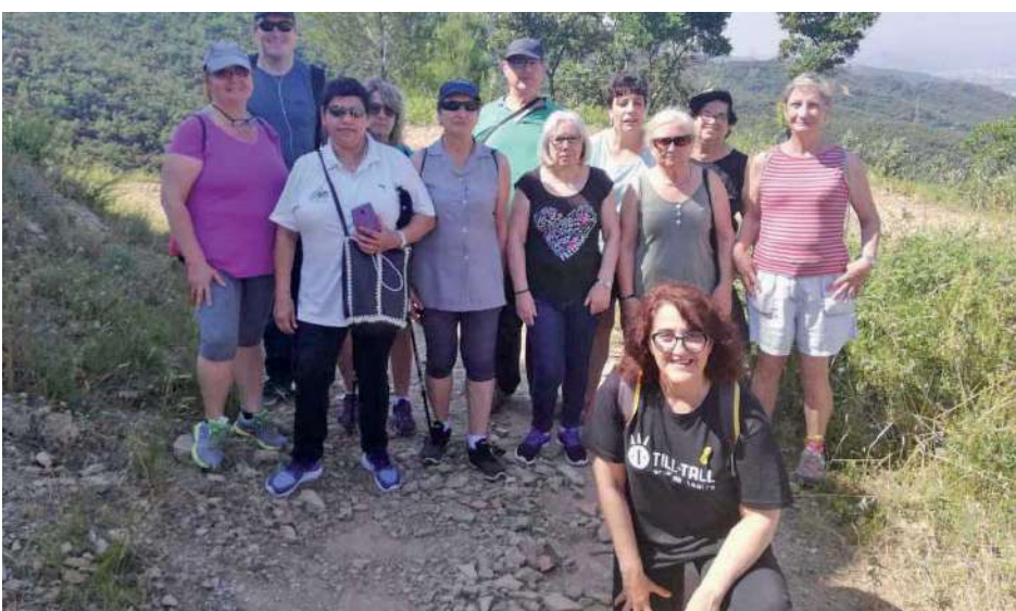
Sortida al telègraf de l'alumnat dels cursos de Català a Montmeló