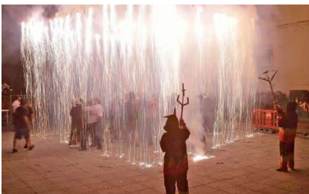
El Rapte