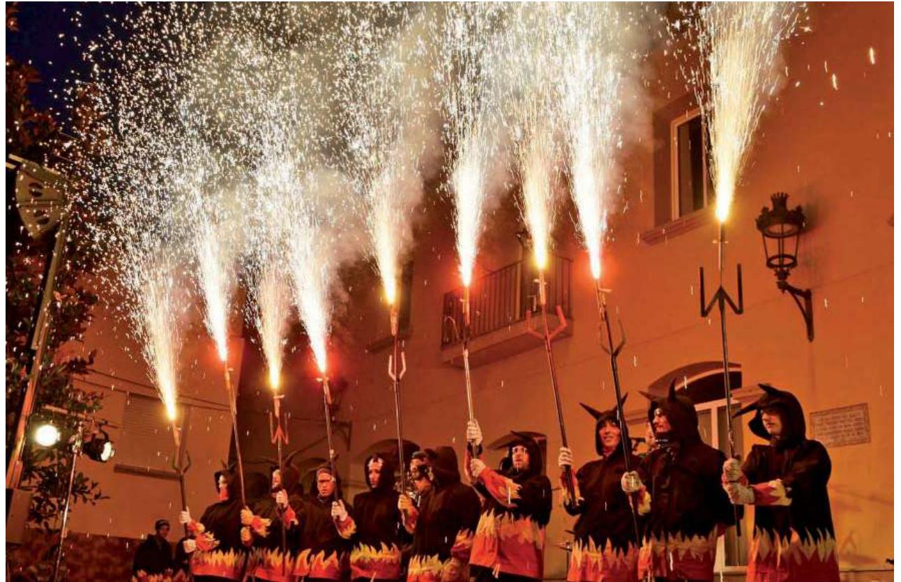
Tronada de Festa Major

A més de la calor, cal destacar finalment l'alt nivell general dels espectacles: els concerts de l'espai Jove de la Torreta, les orquestres de l'envelat de la Quintana. I fer un esment especial als tres espectacles de circ presentats a l'espai de l'Estació Jove.