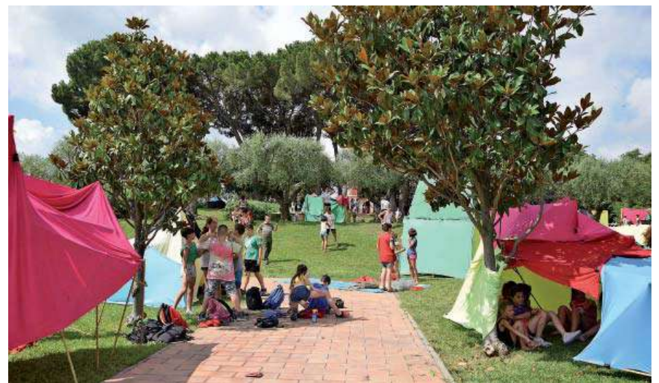
Cloenda Casal d'Estiu: campament de cabanes a la Torreta