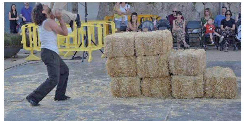
Espectacle de circ Envà