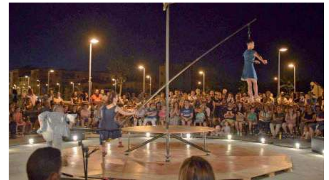
Nit Golfa Familiar. Espectacle Flou Papagallo