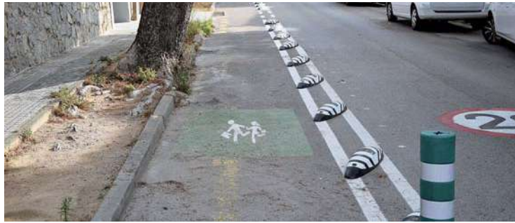
Un municipi on els infants són al carrer és un municipi segur.

A proposta del representant de l'EDE, el Plenari del Consell de Poble va triar la inversió de la primera fase de Camins escolars i saludables per als pressupostos participatius del 2018, que va rebre