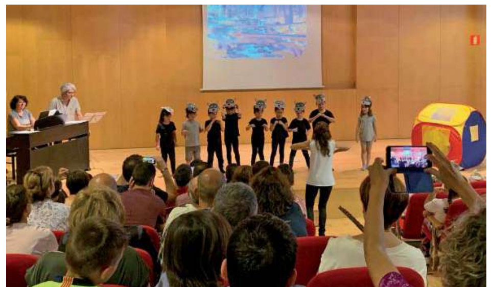
Cantata infantil de l'Escola Municipal de Música