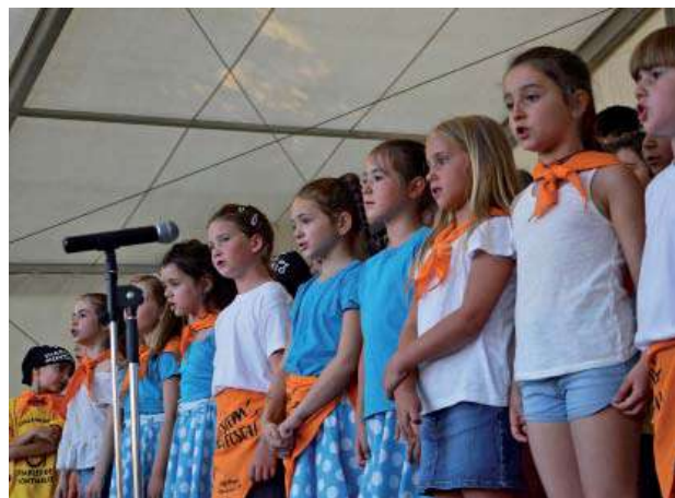
Infants de l'Escola de Música cantant la Polca de Montmeló