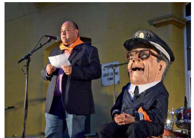
Pregó d'inici de Festa