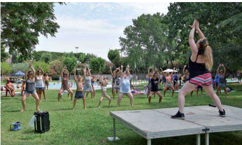
Mulla't per l'esclerosi múltiple. Classe de ball de For Dance Center