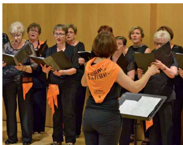
Concert de la Coral de l'Agrupada