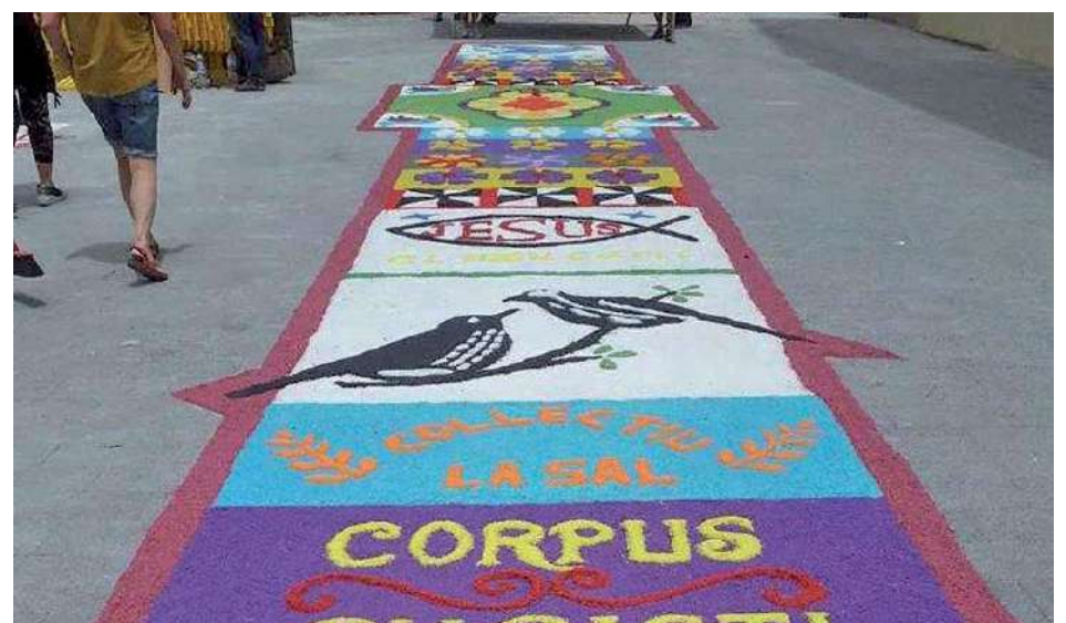
Catifes de Corpus a la plaça de l'Església