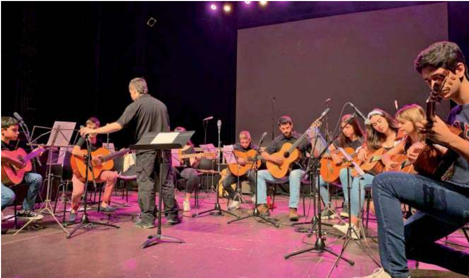
Concert de fi de curs de l'Escola Municipal de Música