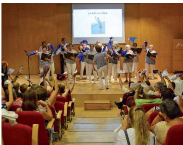
Concert del Casal de la Gent Gran