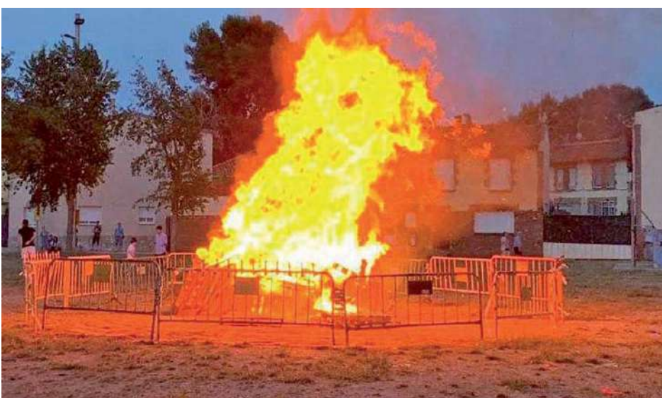
Encesa de la Foguera de Sant Joan a la Cucurny