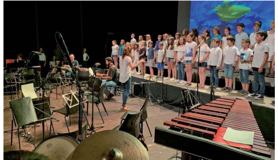
Concert de fi de curs de l'Escola Municipal de Música