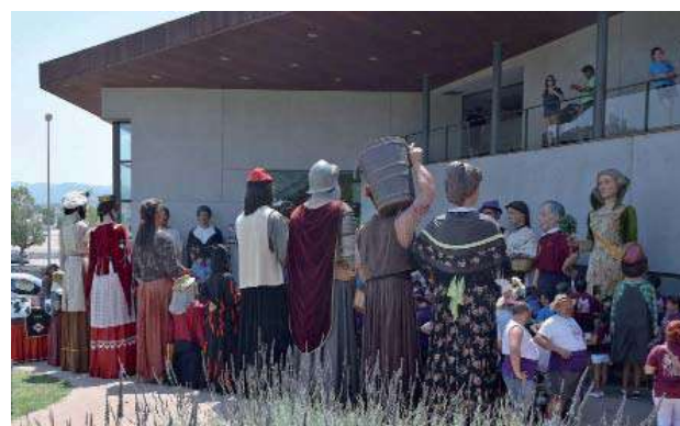
Concentració de Gegants