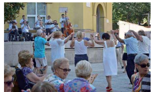
Tarda de Sardanes amb la cobla Selvatana