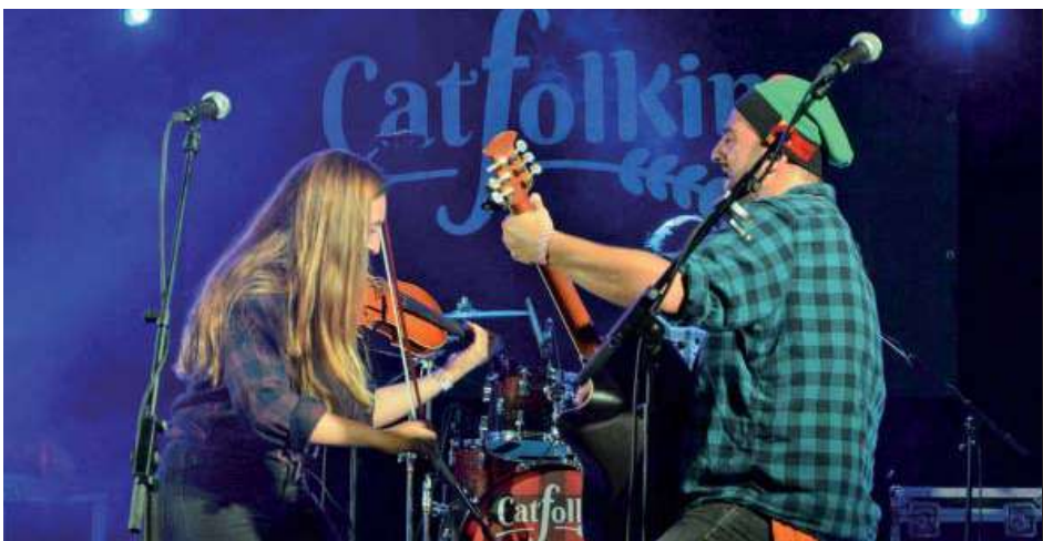
Actuació de Catfolkin