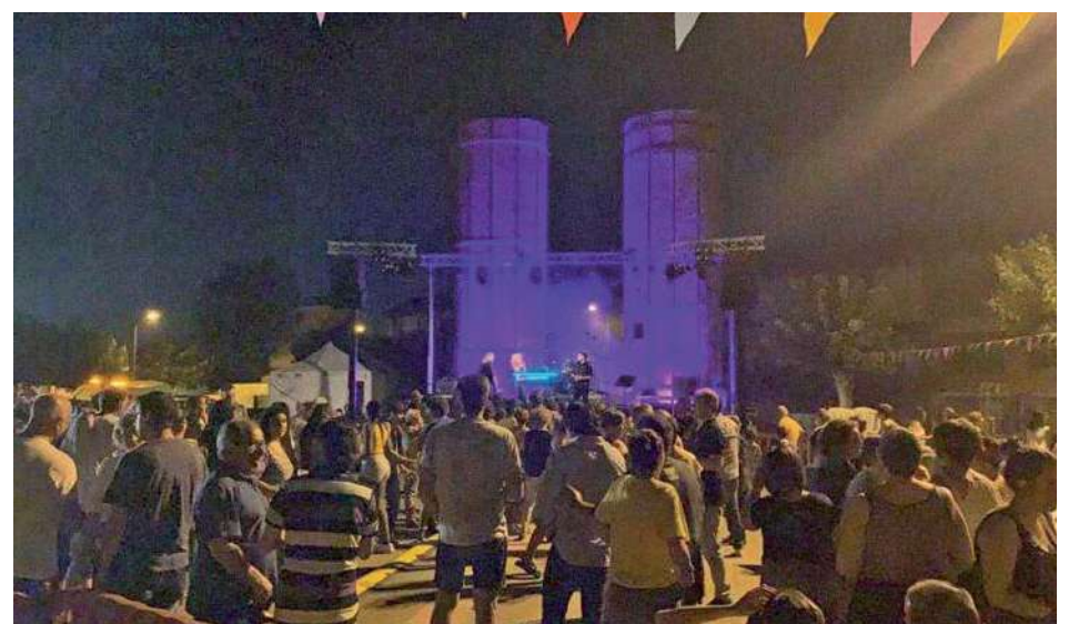
Concert de Sant Joan a la plaça de la Constitució