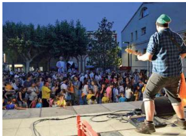
Ball del Toc d'Inici amb Catfolkin