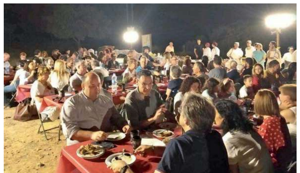
Nits d'Estiu a la Romana: Convivium