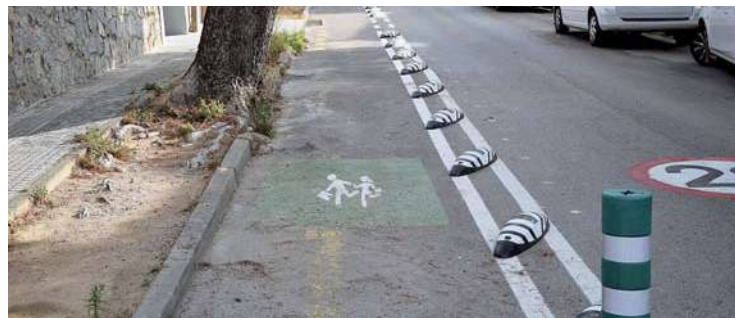
Un municipio donde los niños están en la calle es un municipio seguro

A propuesta del representante del EDE, el Plenario del Consejo de Pueblo eligió la inversión de la primera fase de Caminos escolares y saludables para los presupuestos participativos del 2018, que recibió un total de 415 votos, siendo la