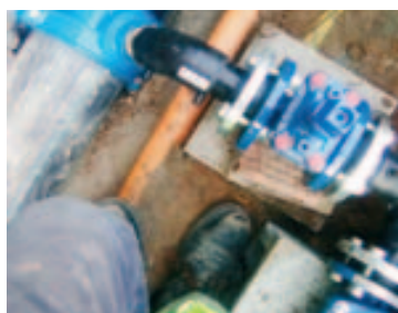
Instalación contra incendios nave en el Camino Antiguo de Can Guitet