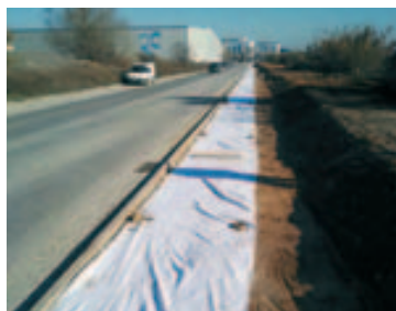
Colocación de malla geotextil en el paseo del río Besós