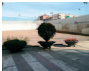
Colocación de jardineras en la plaza de la Estació Jove