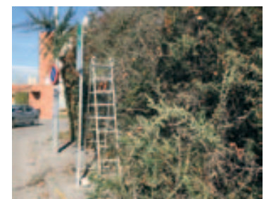
Recorte del seto de la calle Lluís Companys (Sant Jordi)