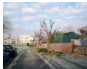
Inicio poda calle Navarra