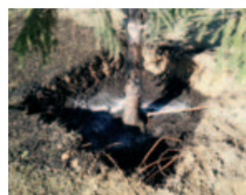
Transplante de un árbol de la calle Lluís Companys a la zona verde del Cementirio