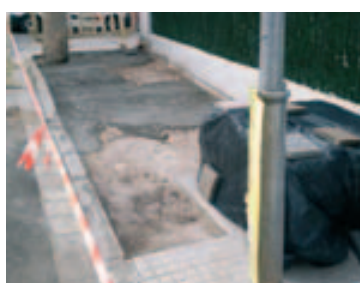
Colocar panots en la calle y pasaje Pintor Mir