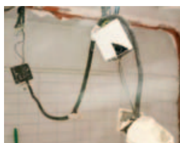
Reparación de la caldera del Casal de la Gent Gran