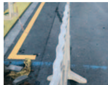
Repintado de zonas de vado, paso peatones y zona naranja