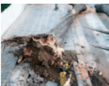
Retirada árboles en la calle y pasaje Pintor Mir