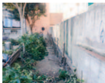
Eliminación seto de la plaza Pablo Picasso