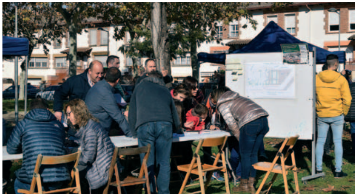
Taller participativo en la plaza de la Constitución