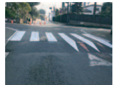
Repintado paso de peatones en distintas calles del municipio