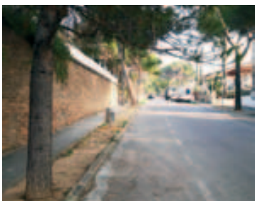
Instalación de papeleras en la avenida Vilardebó