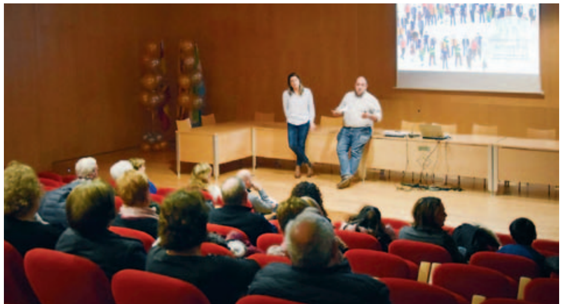
Presentación de los proyectos finales del parque de Sant Crist