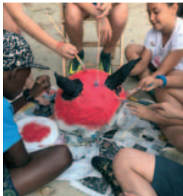
Taller de cabezudos y diablos