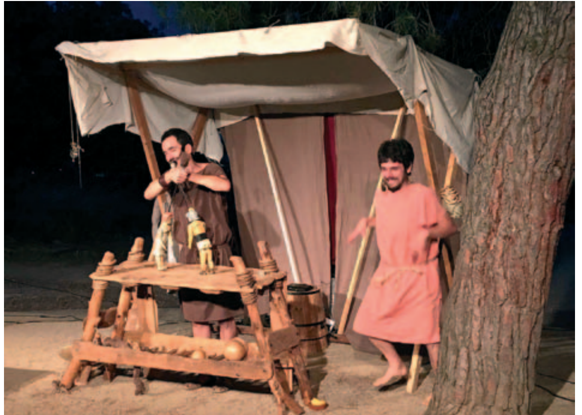
Espectáculo teatral Gladius y Medulina

El viernes 13 de julio, coincidiendo con la noche de luna nueva, llegó el momento de observar el cielo de verano para descubrir estrellas y constelaciones de la mano del polifacético artista Arnau Vilardebó y del astrónomo Albert Pla Sánchez, que presentaron, con la ayuda de un planetario digital, un nuevo espectáculo titulado ‘ Les Llunes de Júpiter ’. Finalmente, el sábado 21 de julio se celebrará la tradicional cena de degustación de cocina romana (convivium) que servirá de clausura a las noches de verano en la romana de este año. ■