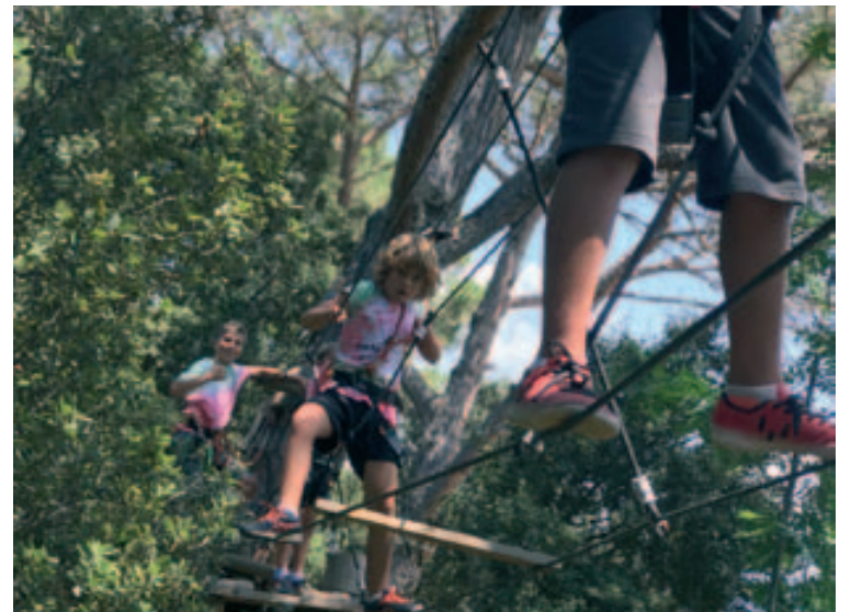
Excursión a Aira Natura

El casal se puso en funcionamiento el 25 de junio y llegan ya a la última semana de actividades. Este próximo viernes 20 de julio finalizarán las actividades del Casal d'Estiu 2018 con una participación de récord. Muchos de los monitores y niños que estos días han participado en el Casal, volverán a encontrarse dos días después, para ir de Colònies d'Estiu o de Camp de Treball durante una semana. ■