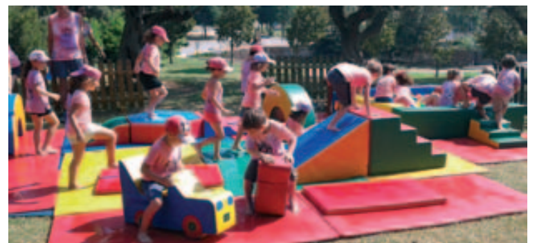
Actividad con agua para los más pequeños

nes, gincanas y agua, mucha agua, bien sea en la piscina o en otros espacios, para combatir el calor y pasarlo muy bien.