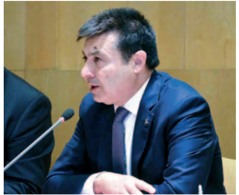
Pleno de renuncia del 14 de julio de 2018

Es evidente que la satisfacción de un responsable nunca es plena. Hay asuntos que me gustaría haber resuelto y que no ha sido posible por circunstancias diversas. Uno de estos es la vivienda para gente joven. El convenio firmado este