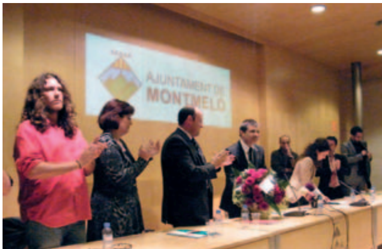
Toma de posesión del 26 de abril de 2010

Este sábado pasado hice efectiva la renuncia a la alcaldía del Ayuntamiento de Montmeló. Cierro un largo período ligado al ayuntamiento que empecé en 1987 y en el que en dos etapas bien diferentes me ha ofrecido la oportunidad de trabajar para la ciudadanía de nuestro pueblo desde esta institución. Una decisión meditada que me permitirá recuperar mi actividad profesional de los últimos 20 años en la empresa privada.