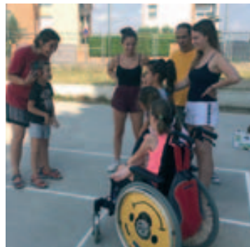
Gincana preparada por usuarios del Centro Ocupacional El Trencadís