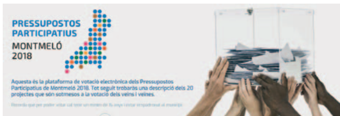
Aspecto de la plataforma tutriesmontmelo.cat

Una vez introducidos los más de 500 papeletas de votación presencial de los presupuestos participativos, se abre la plataforma electrónica tutriesmontmelo.cat para que, en el plazo de dos meses la ciudadanía de Montmeló mayor de 16 años, pueda votar cinco proyectos, entre las veinte propuestas seleccionadas previamente.