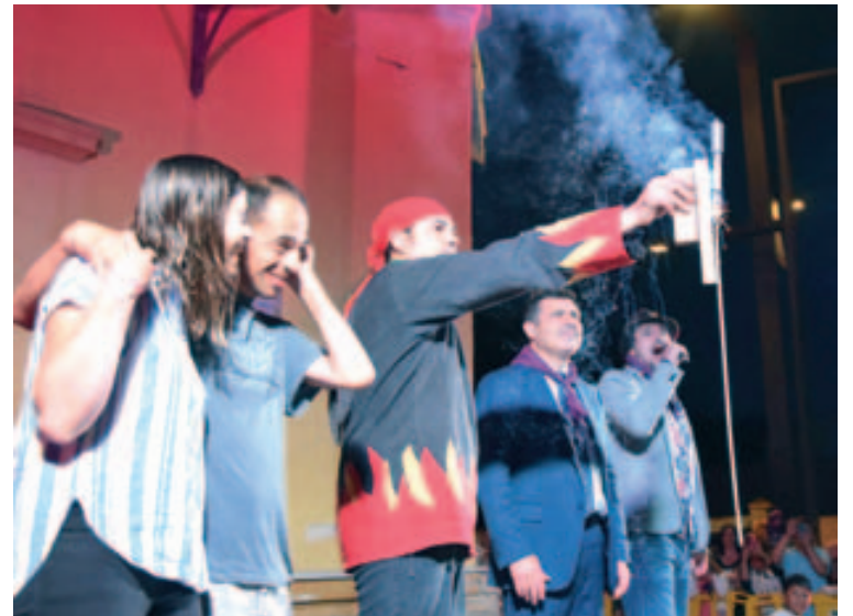
Traca inicial de Fiesta Mayor

El espacio de los jardines de la Torreta ha sido protagonista de grandes momentos durante el conciertos para el público joven: viernes Karaoke Band descubrió más de el talento musical amateur y sábado, la Torreta vivió una larga noche con la actuación de "Los 80 principales". El espacio quedó pequeño durante algunas horas. Y el domingo por la mañana los jardines se llenaron