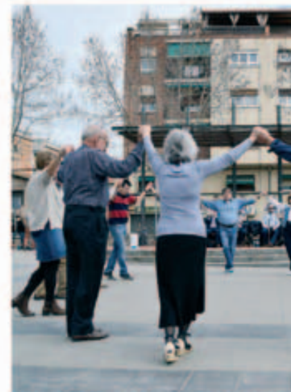
Ballada de sardanes a la Quintar