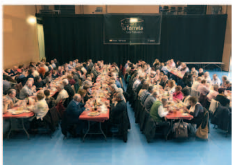
Dinar de germanor de "Segureños" a la Polivalent