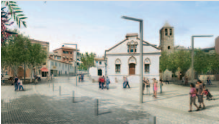
Render del projecte tal com quedarà l'espai urbanitzat

El termini d'entrega del projecte finalitzarà cap a finals de juny, per permetre l'inici de les obres al tercer trimestre del present any. ■