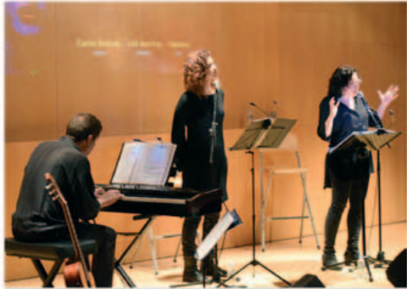
Espectacle "Maleïdes les guerres"