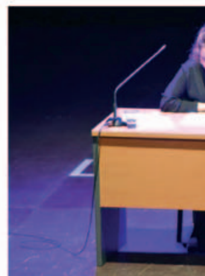
Espectacle "Monòlegs de la vagi