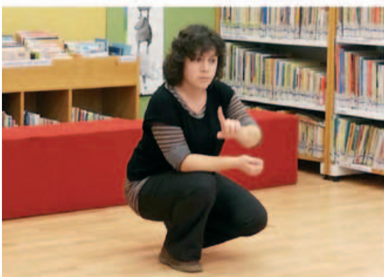
Contes "Princeses blaves i prínceps encantadors"