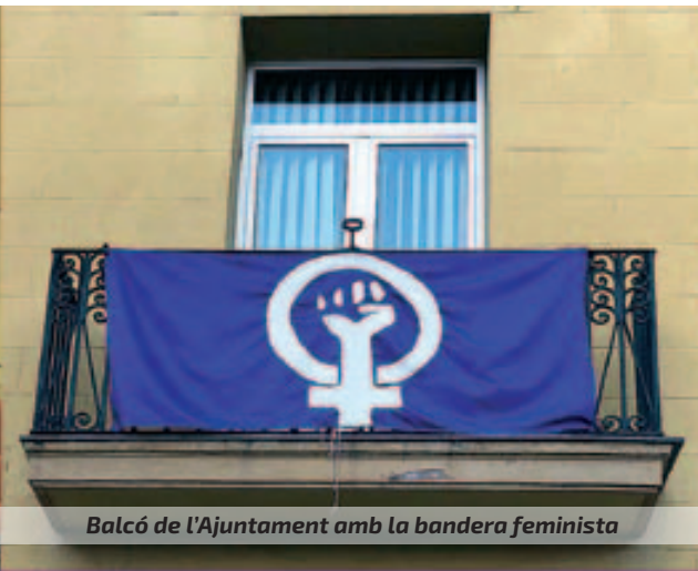
Balcó de l'Ajuntament amb la bandera feminista