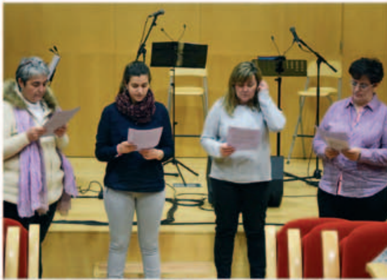
Lectura del Manifest del Dia Internacional de les Dones