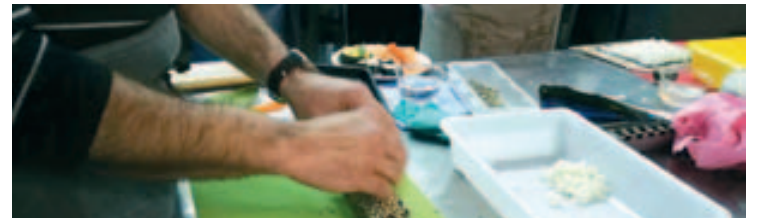
Primer taller de sushi

El Centre Cultural La Torreta ha organitzat un seguit de tallers monogràfics de cuina que s'estan realitzant a les instal·lacions de l'Espai Emprén de la G2M.