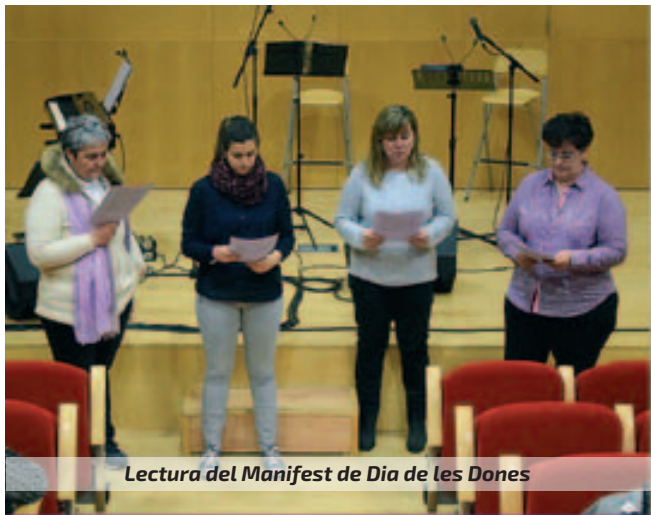
Lectura del Manifest de Dia de les Dones