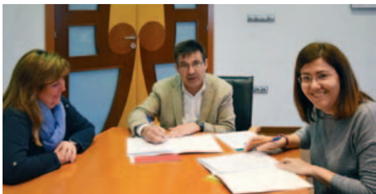
Signatura de col·laboració entre el CDIAP i l'Ajuntament de Montmeló

La detecció precoç de trastorns o riscos en el desenvolupament és fonamental i aquest suport ajudarà en la seva prevenció, detecció i tractament. ■