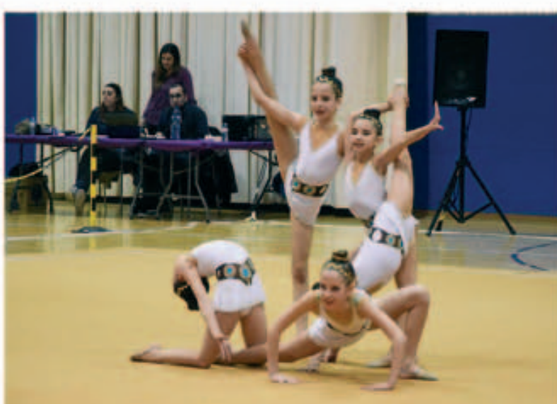
Torneig Vila de Montmeló de rítmica