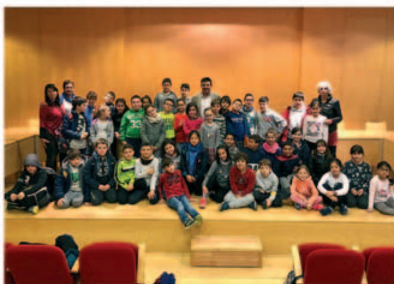
L'escola Pau Casals a l'Ajuntament