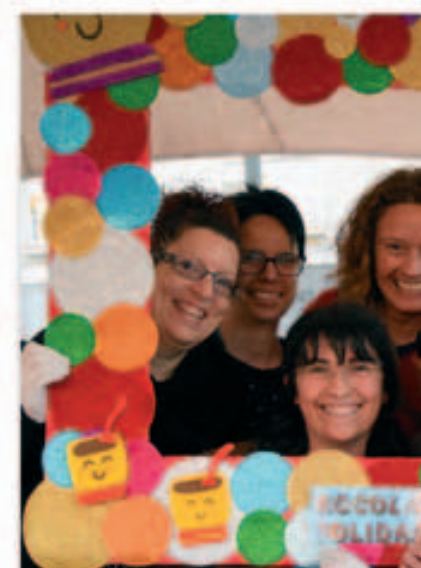
Xocolatada solidària contra el cà