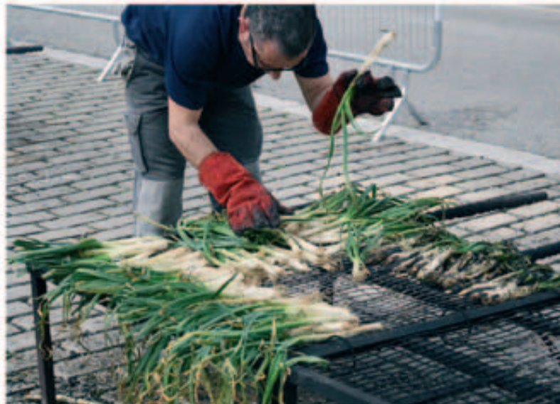
Calçotada popular de la PBMontmeló