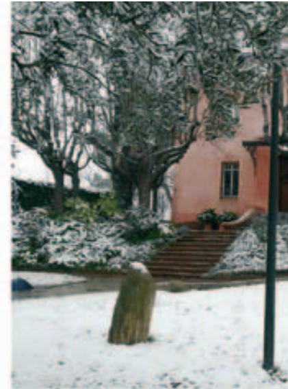
La neu a l'exterior de La Torreta C