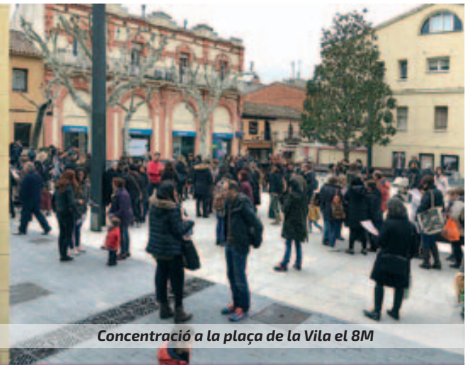
Concentració a la plaça de la Vila el 8M