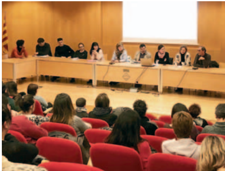
Taula de la xerrada sobre educació de l'1 de març, amb representació de l'alcalde i la regidora de l'Ajuntament, les direccions i les Ampes dels centres escolars i d'un exalumne de l'institut.

Pel que fa a activitats de promoció de la salut, enguany es portaran a terme 43 activitats entre primària i secundària (alimentació saludable, higiene postural, primers auxilis, sexualitat, prevenció de conductes de risc, etc.). A banda de projectes més estables com el de Salut Integral, que es porta a terme