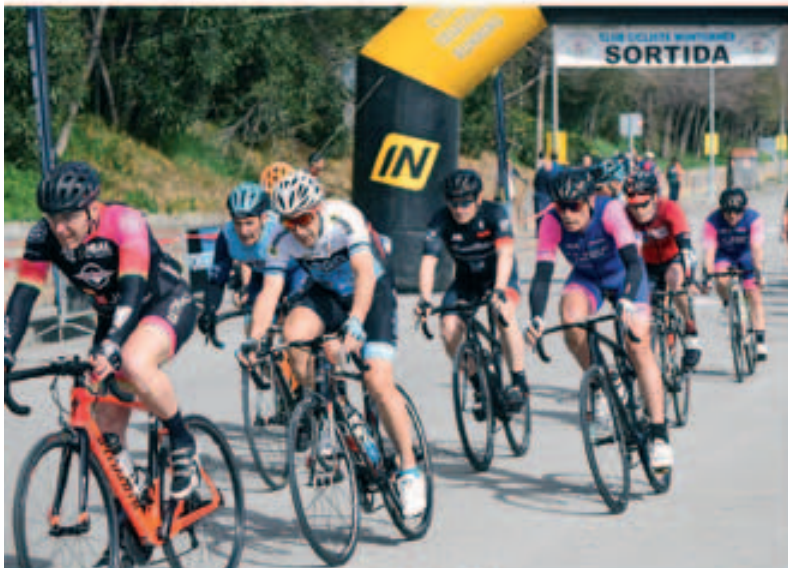
Prova ciclista pels carrers de Montmeló