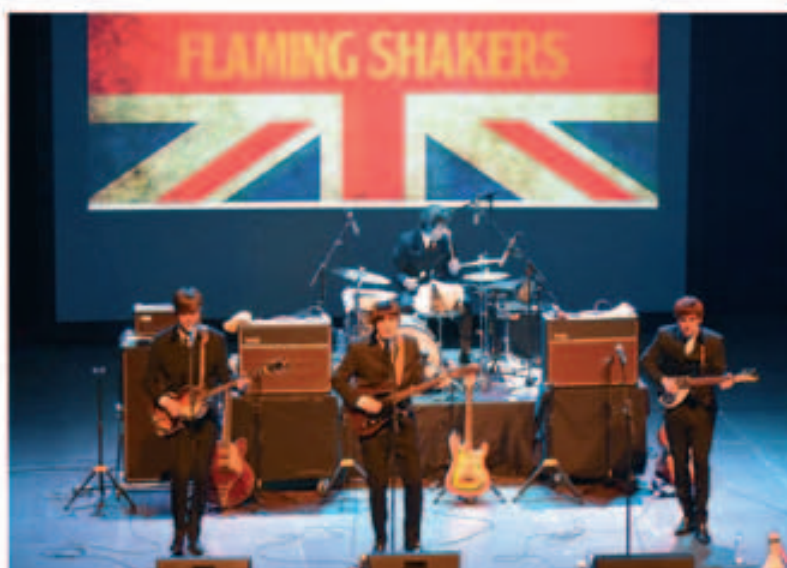
Concert de Flammig Shakers - Tribut a The Beatles