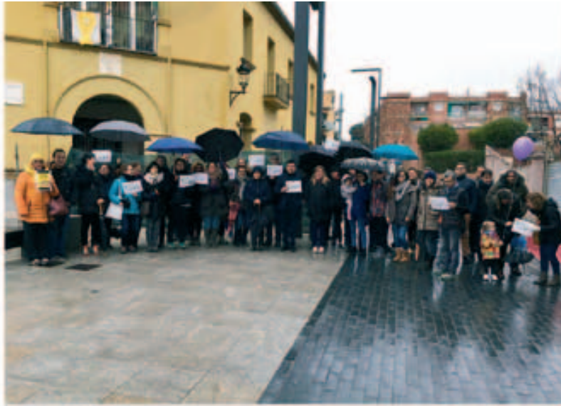
Concentració en defensa de l'Escola Catalana