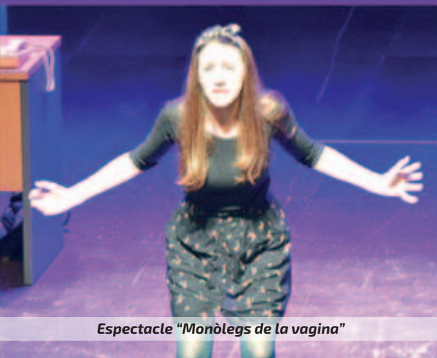
Espectacle "Monòlegs de la vagina"