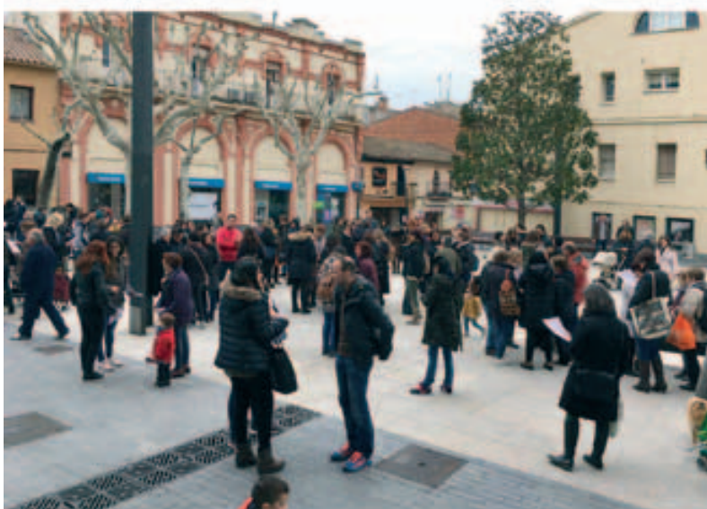
Concentració per a la igualtat de gènere - 8 de març