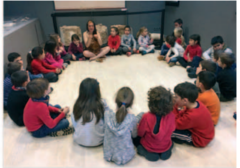
L'escola Sant Jordi al Museu Municipal