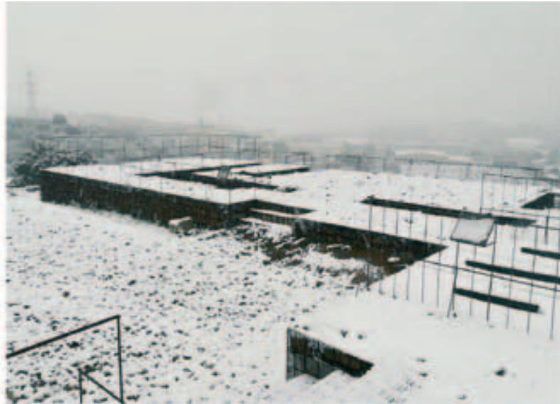
Jaciment de Mons Observans nevad