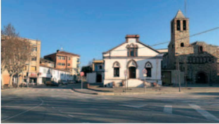
Imatge actual de la zona a reurbanitzar