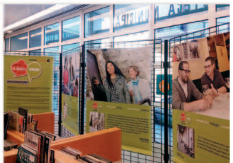
Exposició "A dues veus. Retrats de converses en català"