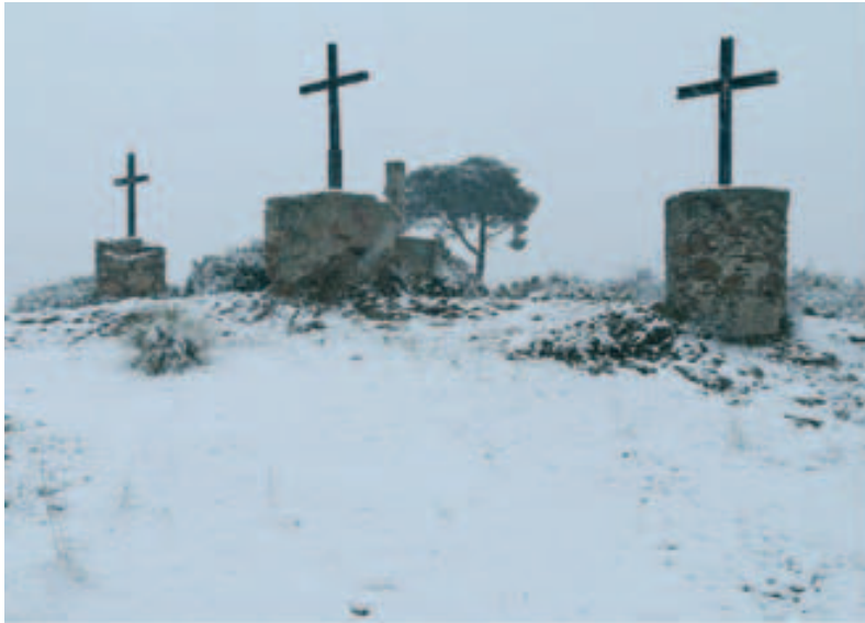
Turó de les Tres Creus nevad