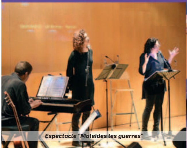
Espectacle "Maleïdes les guerres"