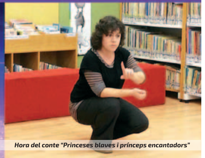
Hora del conte "Princeses blaves i prínceps encantadors"