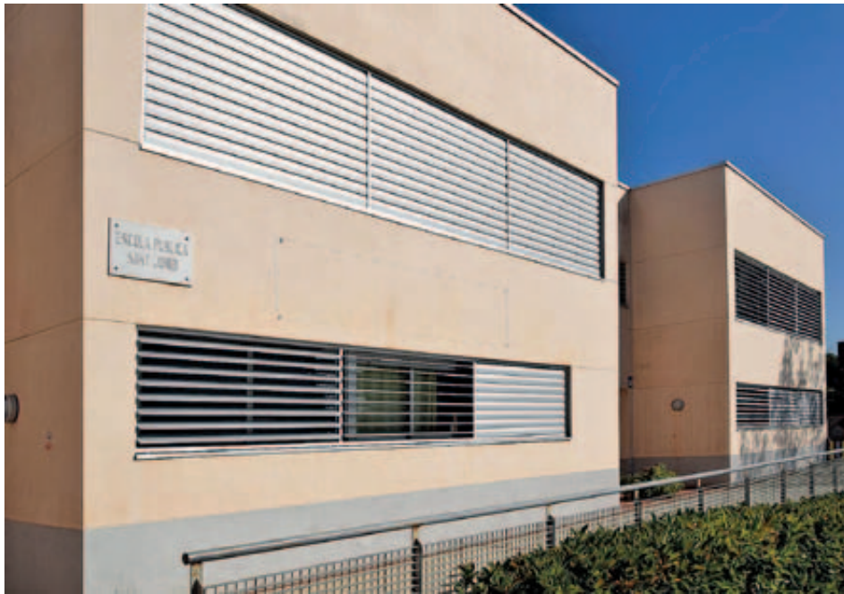
instal·lació de lames en totes les finestres de la façana

L'Ajuntament de Montmeló aprofita cada any l'estiu per a la realització de les diferents tasques de manteniment i obres menors dels diferents centres educatius. L'any 2017, la inversió en reparacions als centres educatius ha estat de 23.225 euros.