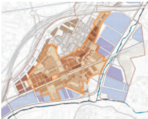
Plànol de Montmeló de la delimitació de la Trama Urbana Consolidada

Fora de la TUC es podran instal·lar PEC amb una superfície de fins a 800 m 2 , ECS (establiment comercial singular), per venda a l'engròs de productes d'automoció, embarcacions, venda de combustible, etc. No es podran instal·lar establiments comercials mitjans, ni grans ni establiments comercials territorials. ■