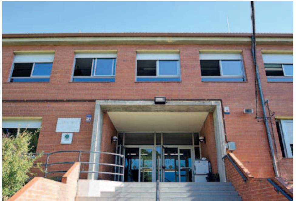
Canvi de finestres a la planta superior

En el cas de l'escola Sant Jordi, l'obra més important ha estat realitzada pel Departament d'Ensenyament de la Generalitat de Catalunya, amb la impermeabilització de la coberta, que ocasionava problemes de goteres i humitats a diferents espais del centre educatiu.